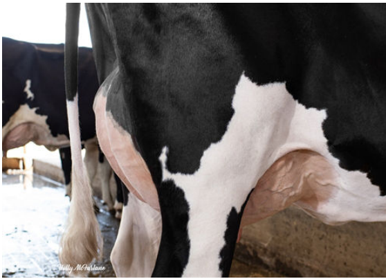
PROGENESIS OUTL WINTERBERRY DAM