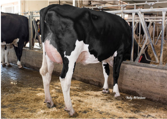
PROGENESIS OUTL WINTERBERRY DAM

PEAK EXPLOSION PROGENESIS OUTL WINTERBERRY VG-88-4YR-CAN 1* PROGENESIS OUTLAST RI-VAL-RE DELTA WING-P GP-83-3YR-CAN 2* MR MOGUL DELTA 1427 RI-VAL-RE EHARDT TEENA-P VG-88-2YR-USA